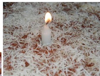
Bolo de mel com chocolate e coco com cobertura