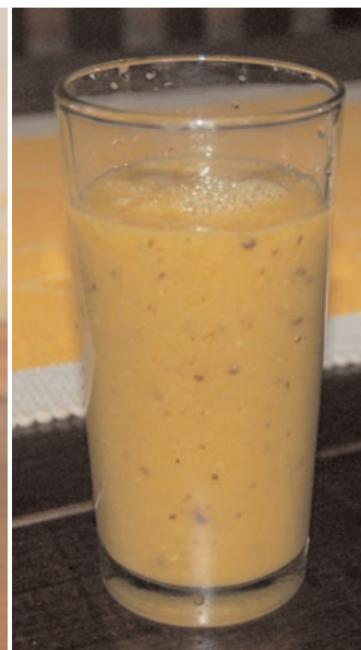
Suco de manga com banana e ameixa