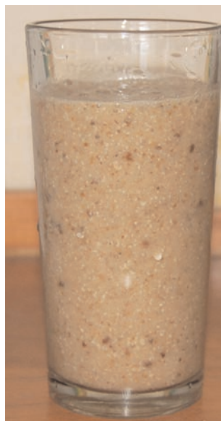
Suco de banana com ameixa