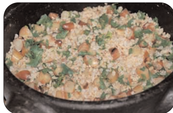
Arroz integral com pinhão