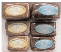
Banana passa "Goura Paraty"