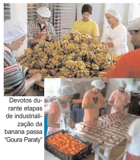
Devotos durante etapas de industrialização da banana passa "Goura Paraty"

Nossa fábrica de banana passa, com a marca "Goura Paraty", acaba de fechar um contrato com o grupo Pão de Açúcar, que inclui também os supermercados Extra, Sendas, Barateiro, e outros. O primeiro pedido foi de uma tonelada. O ritmo na comunidade é de mutirão. O departamento de compras dessa mega empresa nos disse que por termos uma produção limitada, nossas bananinhas estarão nas prateleiras de somente trinta supermercados, todos no estado do Rio de Janeiro. Por ser um produto orgânico, nossa bananinha vai ser encontrada nos locais de