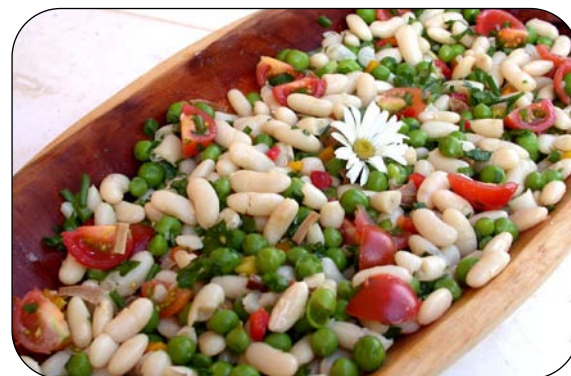
Salada pronta para servir

Obs: Ao se utilizar o tofu seco, ele poderá ser colocado de molho e cozido, junto com o feijão.