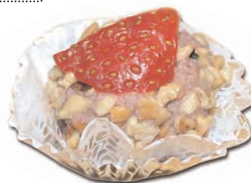
Docinho de morango com castanha de caju